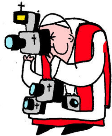
PAPA-YAZZI PAPA NO OFICIAL