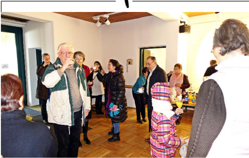
BRINDIS POR EL COMIENZO DEL NUEVO AÑO 2017