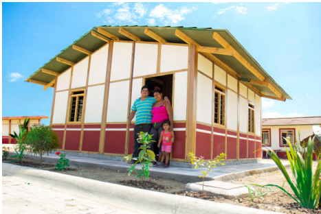
LAS CASAS QUE QUEREMOS AYUDAR A CONSTRUIR EN ECUADOR